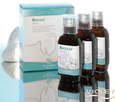
Prix TTC : 45 € par 3

Utilisé de façon conforme aux prescriptions, Régulat Dent ne présente aucun risque pour l'émail dentaire et les gencives en dépit de son acidité. Sa composition 100% naturelle autorise son ingestion.