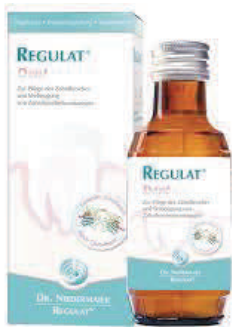
Prix TTC : 16,90 € l'unité

Recommandé par les dentistes, médecins et thérapeutes pour une flore buccale saine.